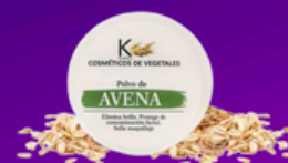
Polvo de Avena

productos para iniciar tu negocio de venta