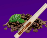
Delineador de Café