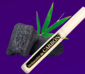
Delineador de Carbón