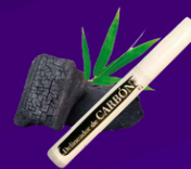
Delineador de Carbón