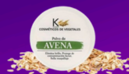
Polvo de Avena

productos para iniciar tu negocio de venta