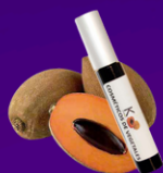
Rimel de Mamey